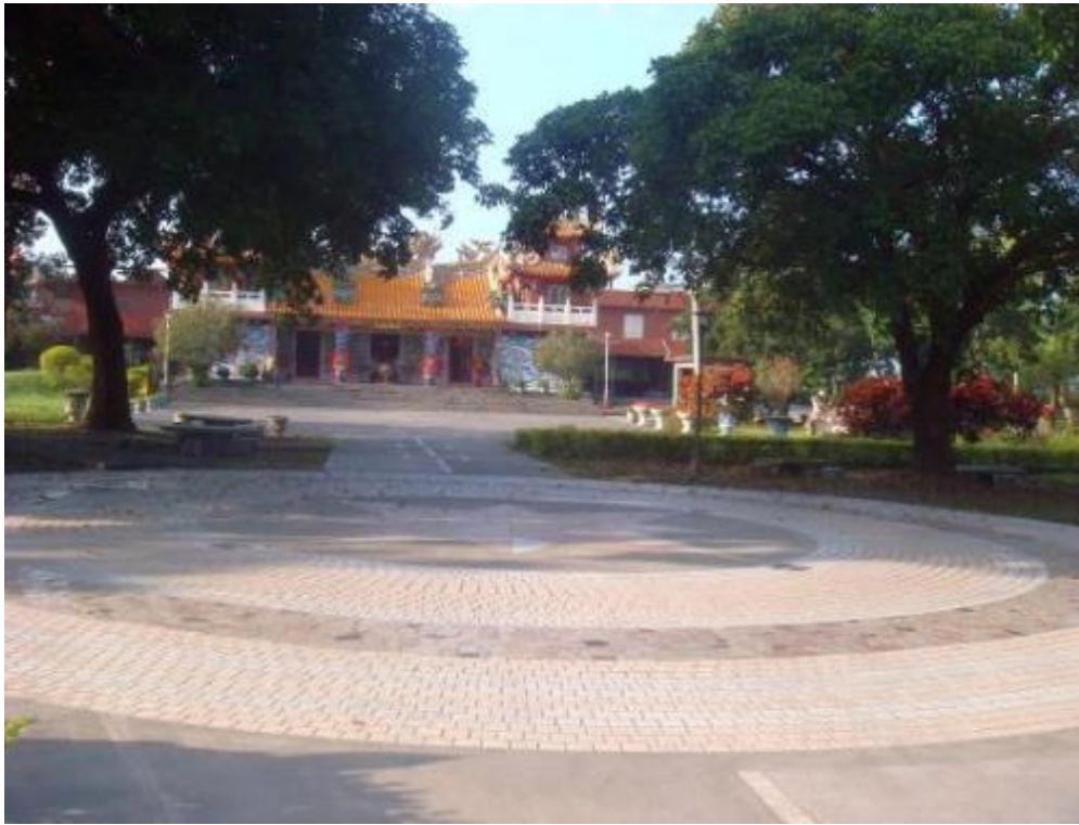
壽豐樂齡學習中心-外部照片-1