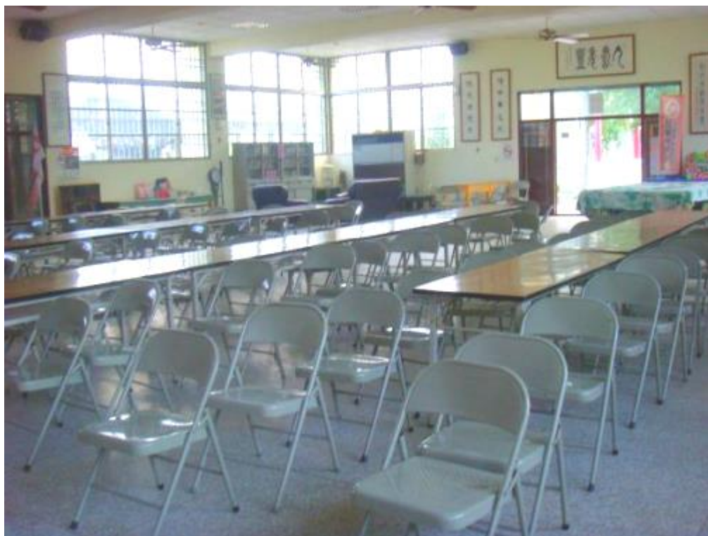
壽豐樂齡學習中心-內部照片-1