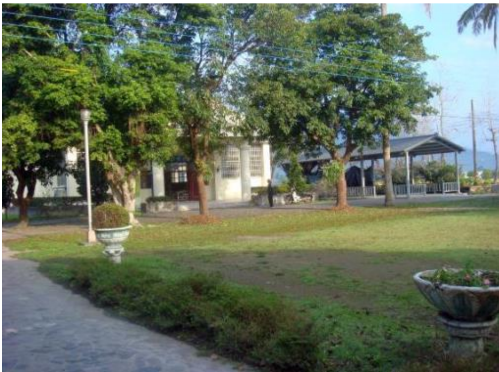
壽豐樂齡學習中心-外部照片-2