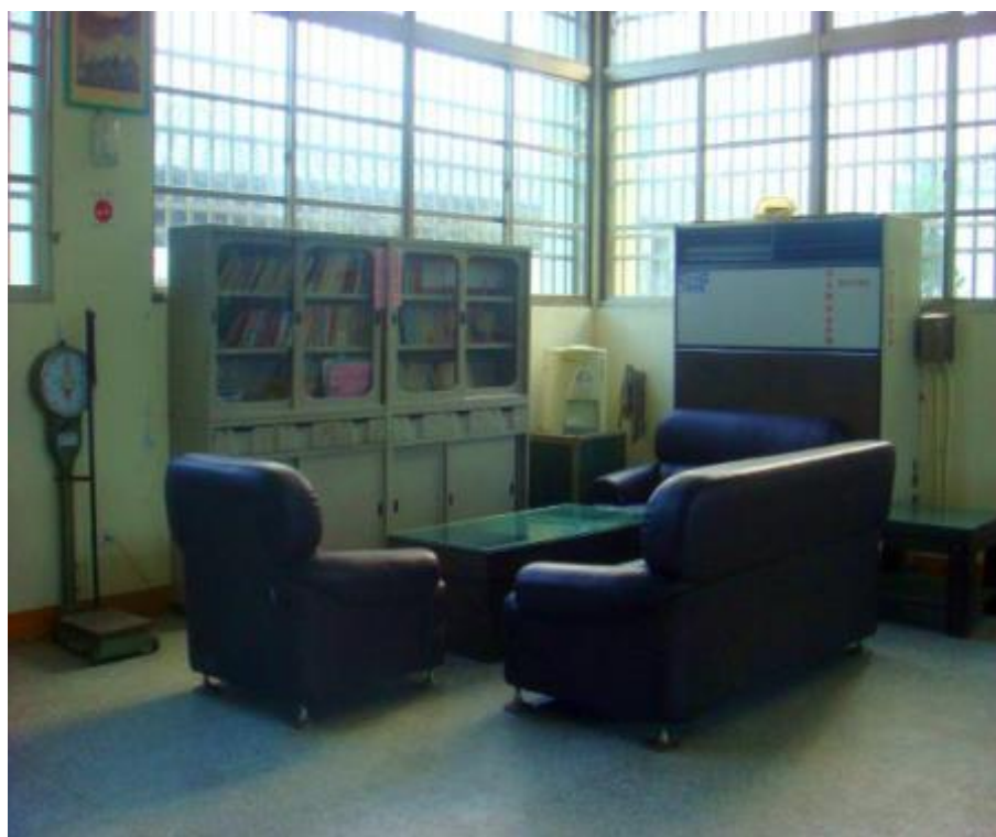
壽豐樂齡學習中心-內部照片-2