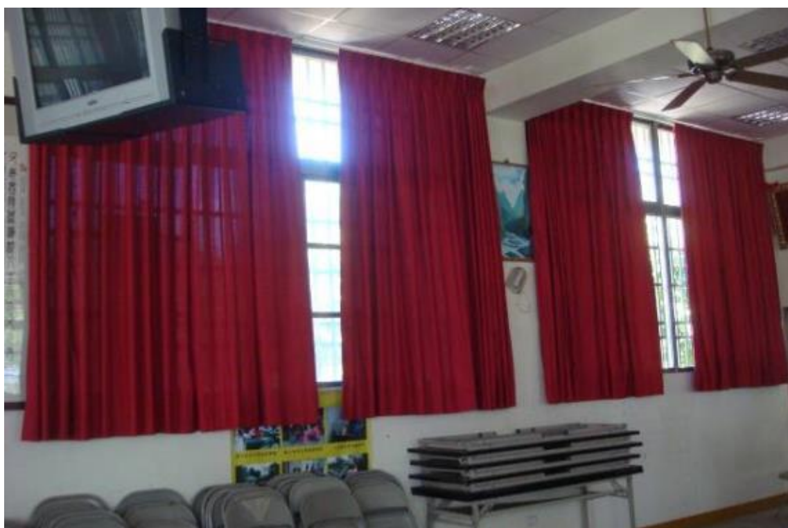
壽豐樂齡學習中心-內部照片-3