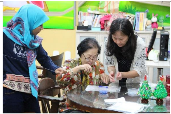
社團手作活動製作聖誕樹