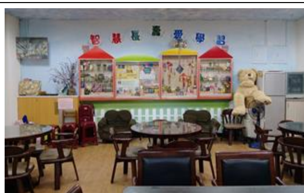
中心內部學員作品展示區