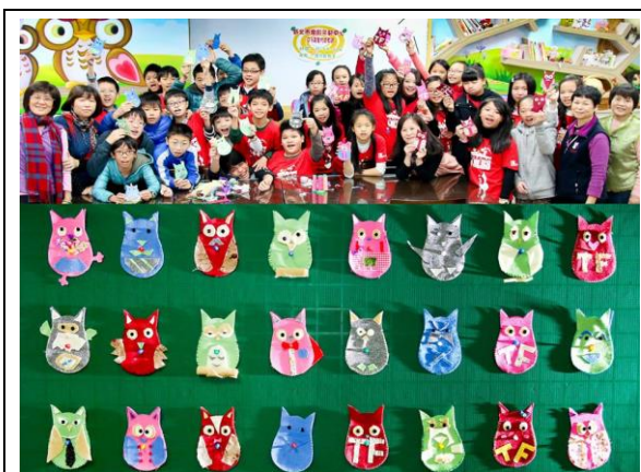
班級代間教育貓頭鷹手作

代間教育，本課程結合樂齡志工及樂齡學員，將本中心社團手作編織課程所學、故事巡腳與多元文化美食活動，利用代間教育的方式與校內及校外學生互動進行教學並且結合重陽節活動。教學效果佳，教學氣氛十分融洽，不僅帶動學生的興趣，也增進樂齡長者的成就感。