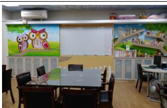
中心內部貓頭鷹情境布置

「智慧、長壽、愛學習」是三重樂齡示範中心的核心價值，其中智慧代表「智慧傳承」、長壽代表「健康老化」、愛學習代表「終身學習」，自 98 年起迄今 8 年的時間秉持著核心價值不斷精進前進成為示範中心，貓頭鷹充滿智慧的象徵是中心成立之初一致認同的吉祥。中心一直以提供優質的學習課程與舒適的空間環境讓每位進到中心的樂齡學員都有美好的體驗經驗，空間的規劃上，巧妙地將貓頭鷹吉祥物圖像與前面的白板結合，並將樹枝融合書架與展示架的功能，讓環境布置與核心價值融為一體，後面用樹屋的意象將學員的作品並其展示交流，舒適的桌椅更成為學員喜歡固定聚會的地點，中心不只是學習的地點，更是人與人交流的最佳場所。