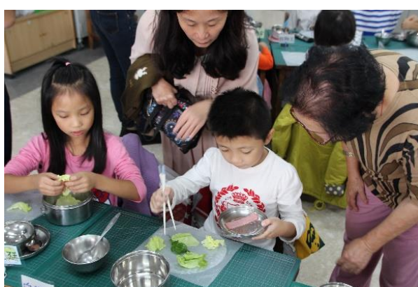
越南春捲美食製作活動