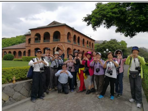
淡水攝影課程外拍活動