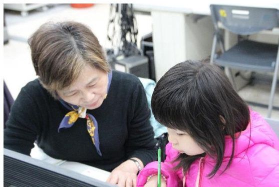
課業輔導活動協助弱勢學童