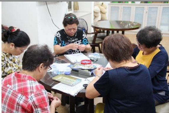
學員研究串珠製作