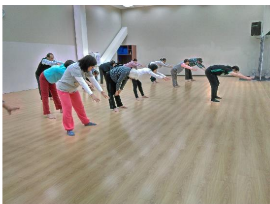
運動中心太極拳專班

課程規劃核心課程主要以運動保健課程最受歡迎之項目，其中並結合新北市動健康之政策與三重運動中心之課程。中心課程除了聘任教育部推薦專業核心課程講師，並協同三重運動中心開設有氧飛輪與大極拳樂齡專班，另在原有的課程中加入有趣的手部運動活動，讓學員能夠時時運動，養成正確運動的重要習慣，並以多元的自主課程規劃提供學習豐富度。