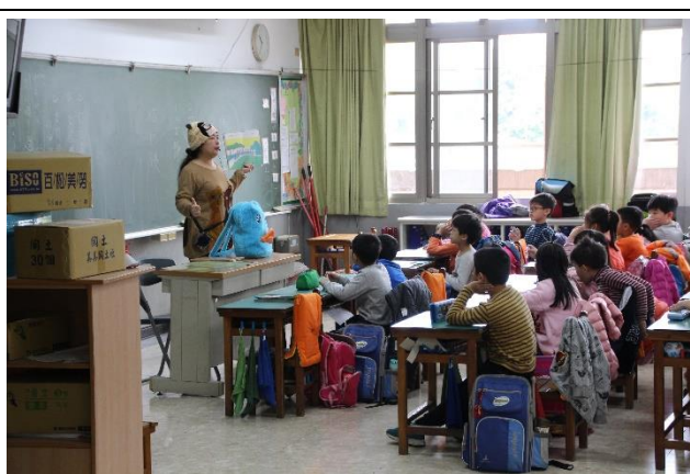
故事巡腳至各班講故事