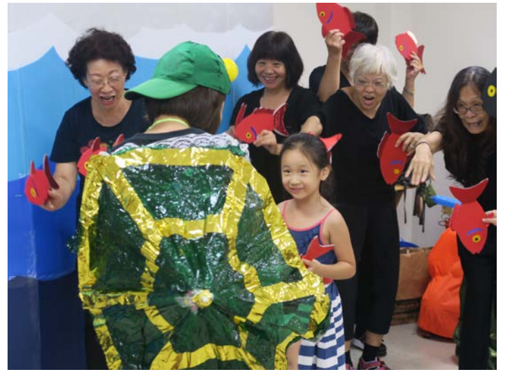
與小朋友一起同樂