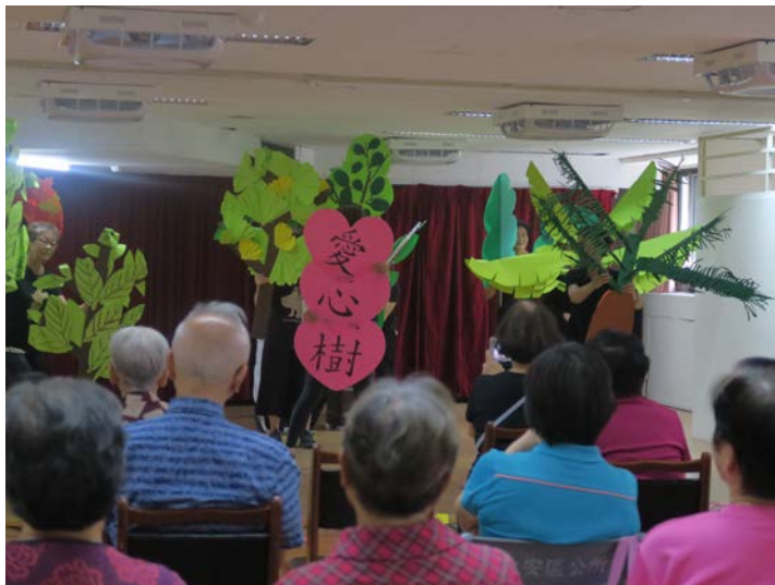
至安養中心做關懷表演