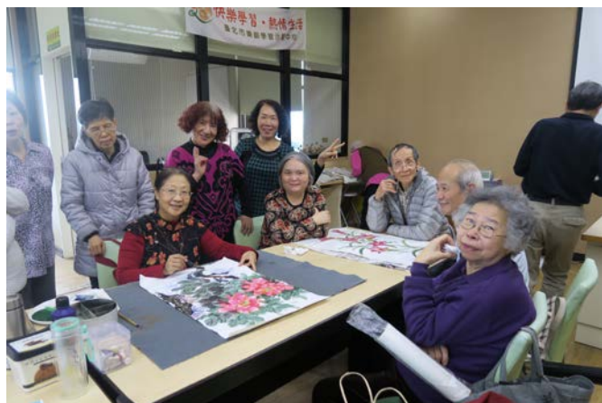
國畫自主學習小組