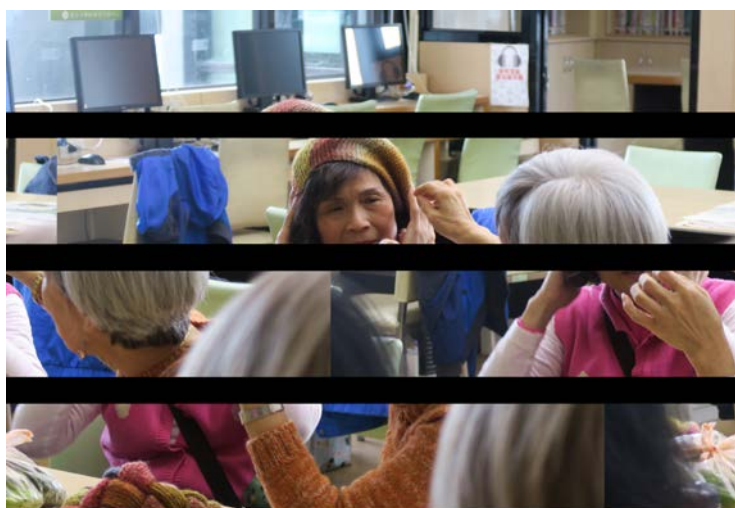
快樂銀髮毛線編織班