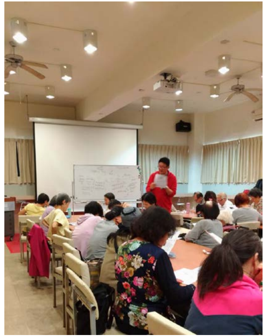
講師講授文章內容