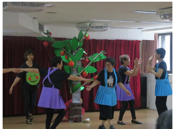
學員從表演中獲得樂趣