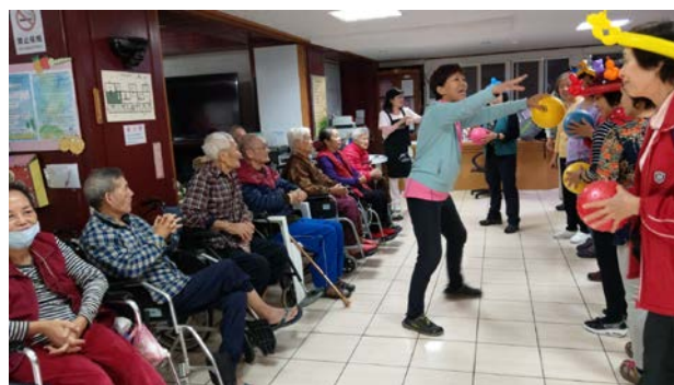
樂齡中心貢獻課程到安養中心與其他長者同樂