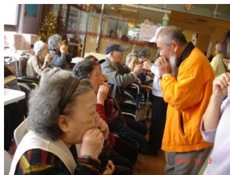
樹葉吹奏班到安養中心表演並教高齡者吹奏樹葉。