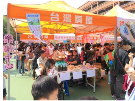
環保酵素肥皂社參與慶祝 兒童節環保園遊會