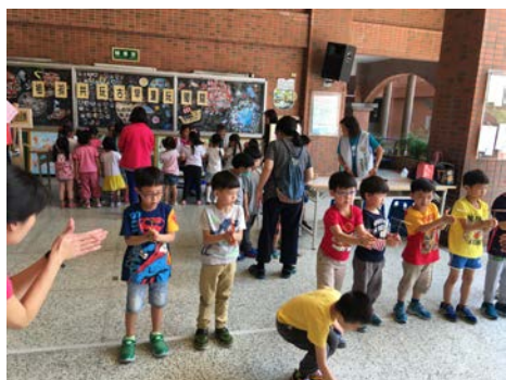
樂齡參加祖孫共學玩童玩活動