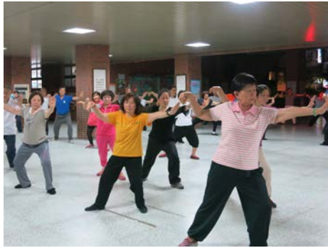
新北動健康楊家老架太極 拳社上課情形