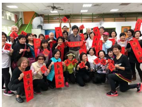
書法社大師揮毫，歡喜過年在重慶拓點

春贈春聯活動、回憶人生班進行社區長者關懷活動、“樹葉”及“鼻笛”吹奏社進行社區長者關懷活動、生活美學-編織藝術手創班學員進行社區長者關懷活動、後埔樂齡健身竹板班學員進行社區長者關懷活動……等。