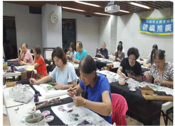
【樂齡學習社團】樂齡國畫社