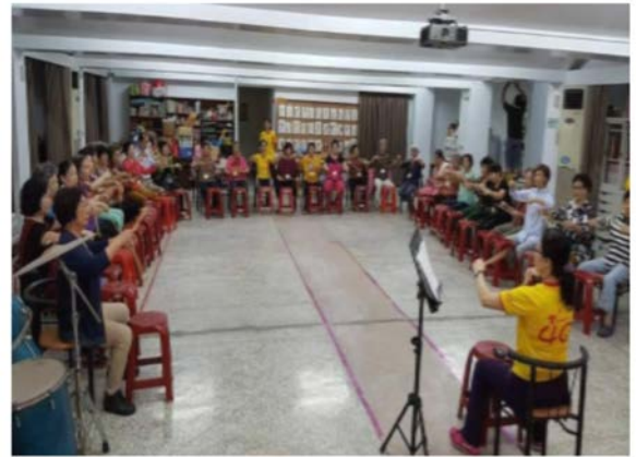
【服務方案】打擊樂遊玩樂齡關懷服務