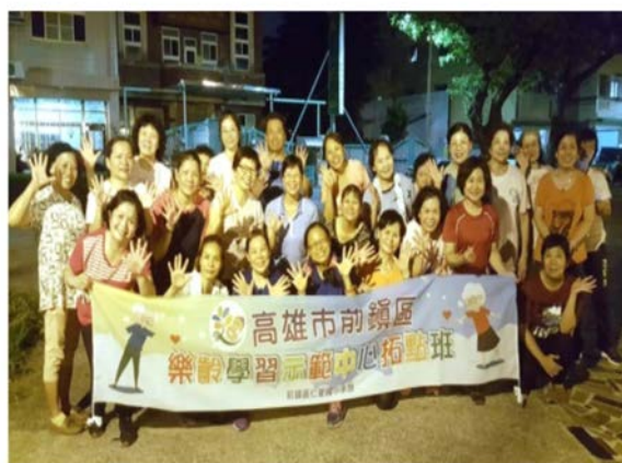
【興趣課程】音律活化健康操