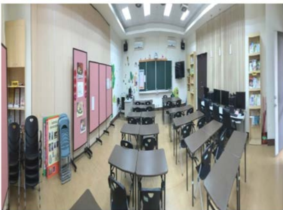
高雄市樂齡學習示範中心空間