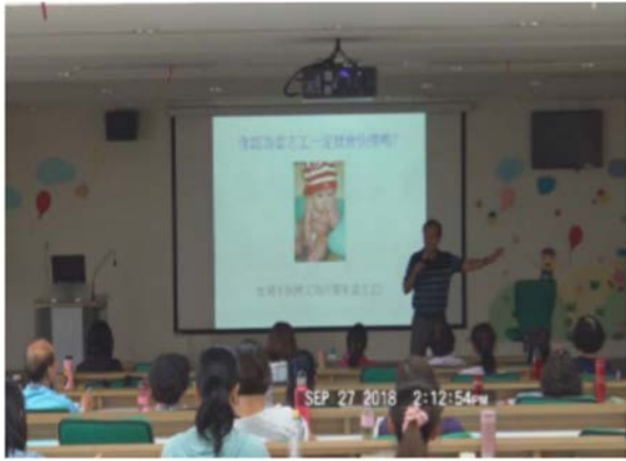
【志工成長課程】樂齡志工進修課程