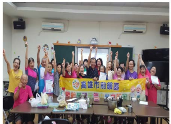
【社會參與】樂活人生-退休學習