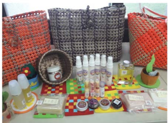
【興趣課程】編織巧手生活坊

本中心從預防教育、創意及創新老化等觀點開設【興趣課程】，包括：旅遊日語輕鬆說、書法國畫樂齡學堂、編織巧手生活坊、排舞 Easy Go!、音律活化健康操、電腦初階小學堂、手機 APP 應用進階、手語律動、樂活玩皂創客坊、療癒烏蟲體習字、心境藝術彩繪素描、樂齡美語 Easy Talk! 等。