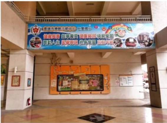
高雄市樂齡學習示範中心外觀