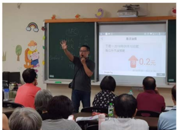
【興趣課程】手機 APP 應用進階