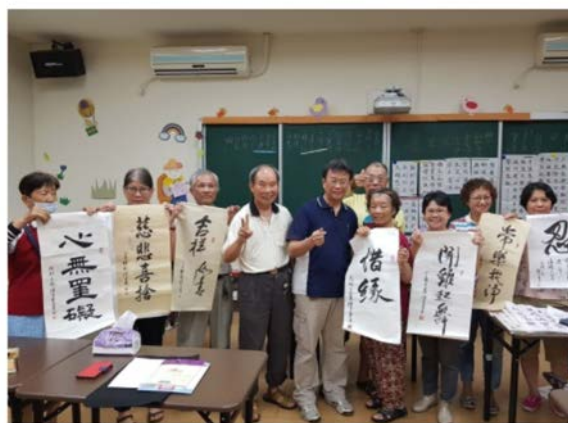
【興趣課程】書法國畫樂齡學堂