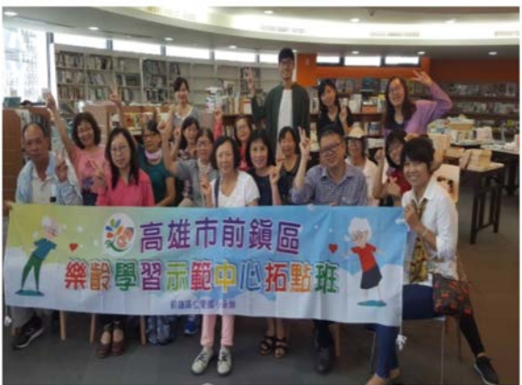
【心靈成長】電影話人生讀書會