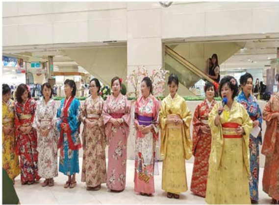
【樂齡學習社團】樂齡日語社