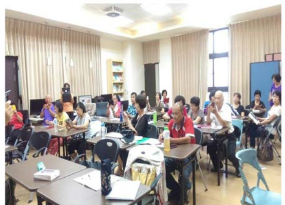
高雄市樂齡學習示範中心空間