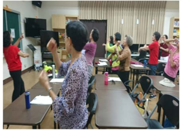
【樂齡學習社團】養生保健手語律動