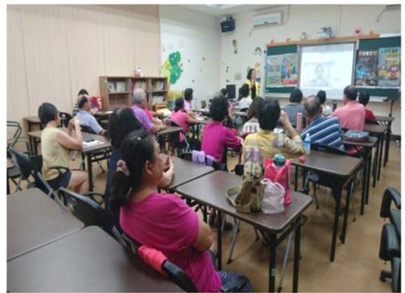
【生活安全】交安樂無憂