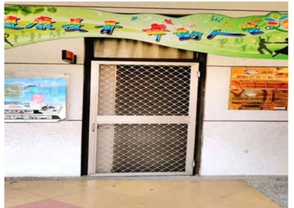
高雄市樂齡學習示範中心外觀