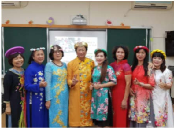
【服務方案】新住民文化樂齡體驗服務