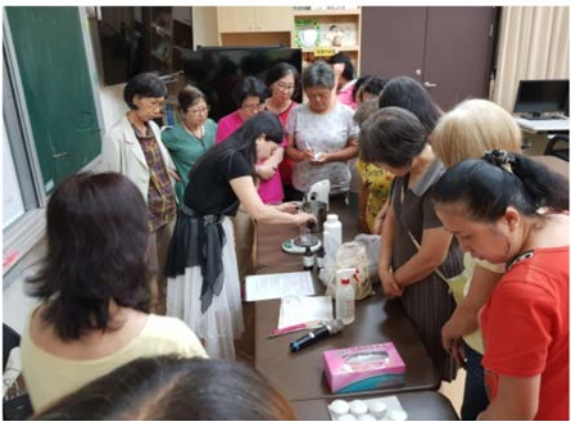
【人際關係】情緒芳療人際社群活動

本中心從預防醫學、高齡者用路安全、最適、創意及創新老化等觀點開設樂齡五大類核心課程，舉凡【生活安全】：食在健康好生活、交安樂無憂；【運動保健】：樂齡有肌好動體適能、樂活養生；【心靈成長】：電影話人生讀書會；【人際關係】：科技樂齡生活、情緒芳療人際社群活動、旅遊學習~樂齡逍遙遊；【社會參與】：樂活人生-退休學習、樂齡法律講堂~預防失智相關議題等。