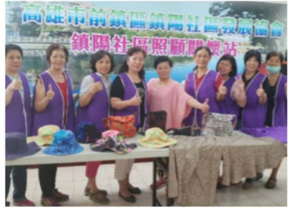
【服務方案】縫紉创客樂齡長者風華再現