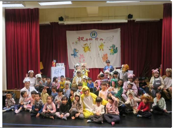
劇團成員與幼兒園孩子大合照