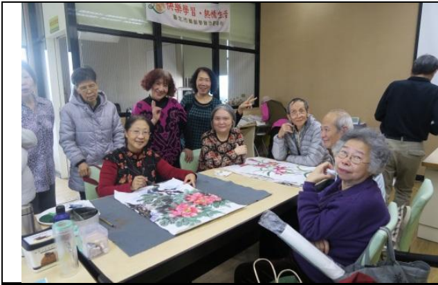
老師帶領練習山水花鳥等墨畫