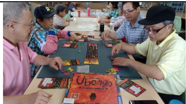
學習各種益智有趣的遊戲