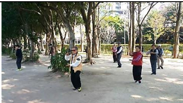
學員一起在大安森林公園打太極拳