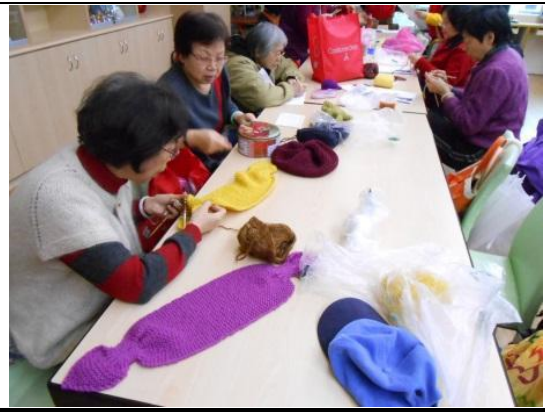
學員互相為學習編織的楷模對象