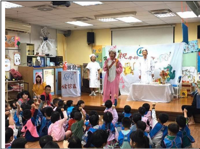
幼兒園孩子全神投入戲劇中