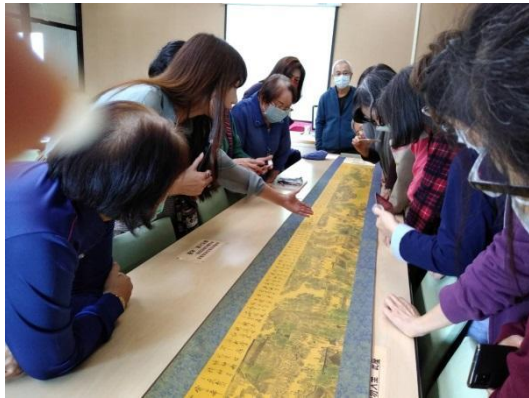
給大人重溫的國文課