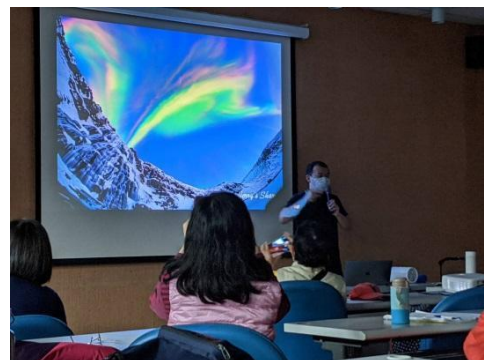
樂齡偽出國—世界我來了