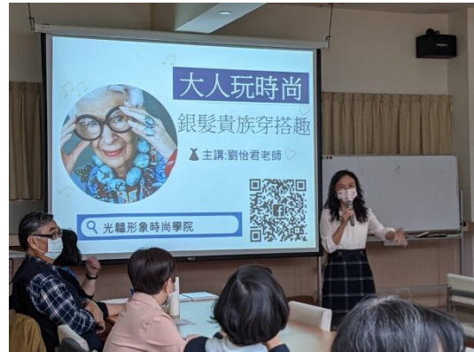
天生衣架子—樂齡時尚穿搭