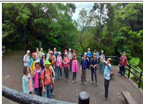
在地文化導覽人員培訓