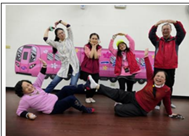
平鎮路通劇團表演

高齡者熱門樂團-平鎮八號樂團，讓許多高齡者完成玩音樂的夢想。藉由音樂連結世代，老歌翻唱超搖滾，帶著青春不老的熱情，挑戰大型舞台 HIGH 翻全場，再創生命價值，11年的教育讓團員走入樂齡的正循環。