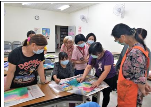
粉蠟筆的推畫世界