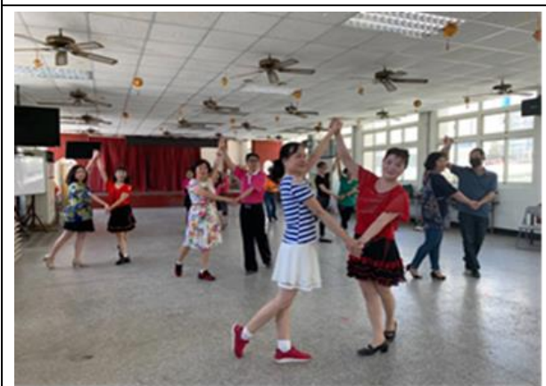
輕鬆國標健美操恰恰