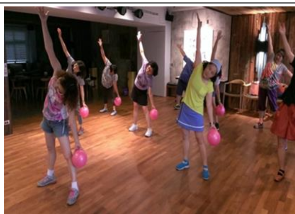
多元銀髮體適能舞蹈