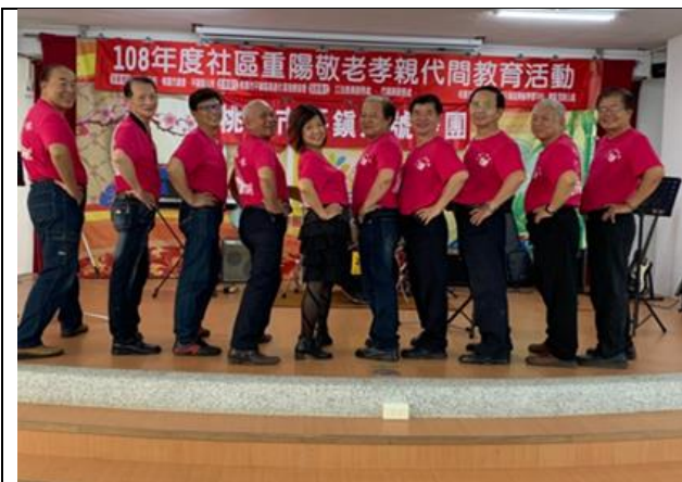
社區重陽敬老代間教育活動展演