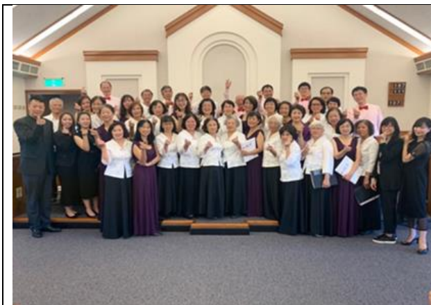
2019 荷平交流音樂會@聖徒教會