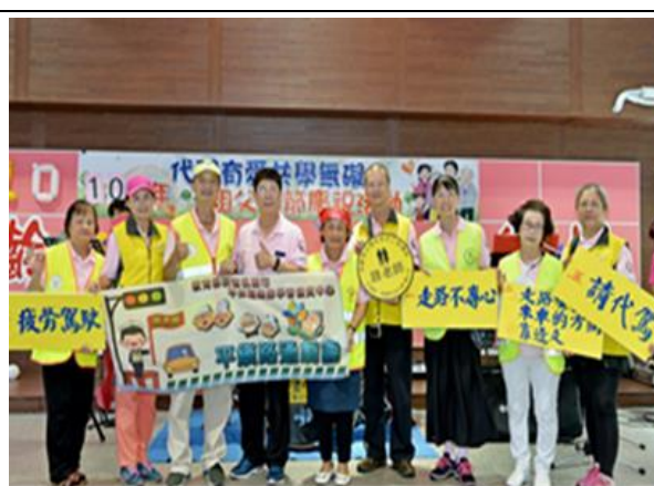
平鎮路通劇團表演