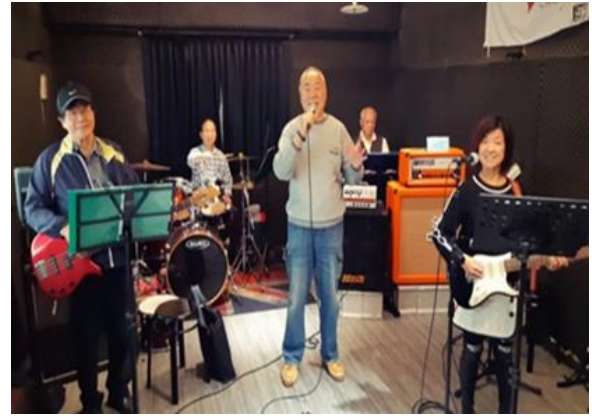
平鎮八號樂齡樂團表演