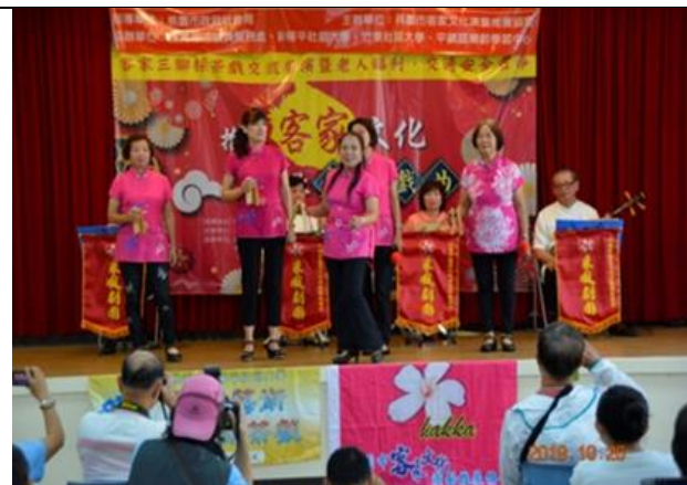
客家採茶戲交流活動表演