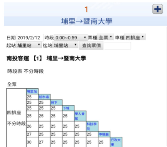
補充: 點選步驟 4 中【票價】，即可查詢票價