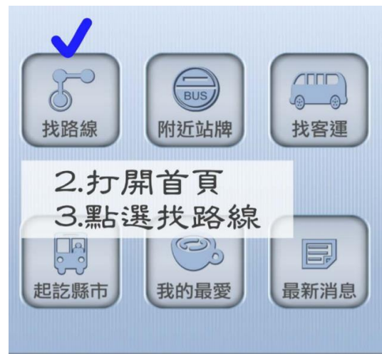
步驟 2: 打開首頁點選找路線