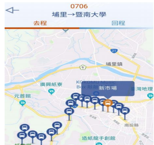
補充: 點選步驟 4 中【站牌地圖】，即可查詢站牌位置