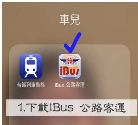
步驟 1: 下載 iBus 公路客運 app