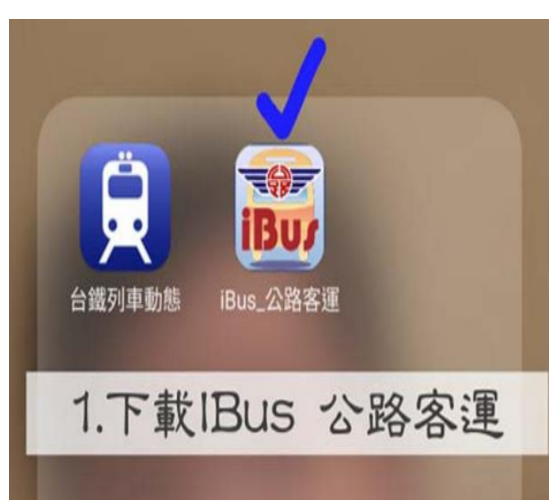
步驟 1: 下載 iBus 公路客運 app