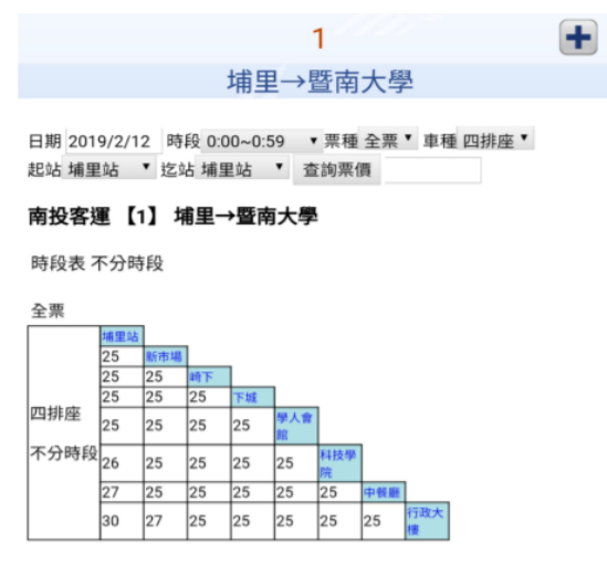
補充: 點選步驟 4 中【票價】, 即可查詢票價