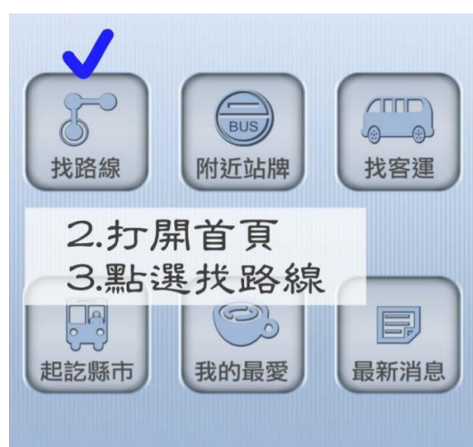
步驟 2: 打開首頁點選找路線