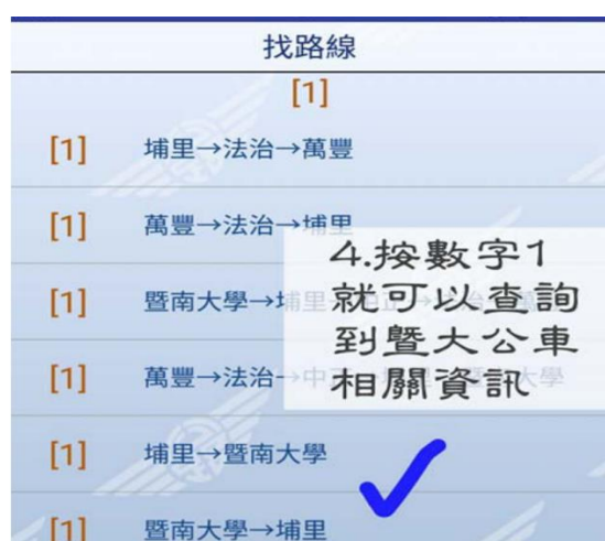
步驟 3: 按數字 1, 即可找到南投客運 1 路區間車