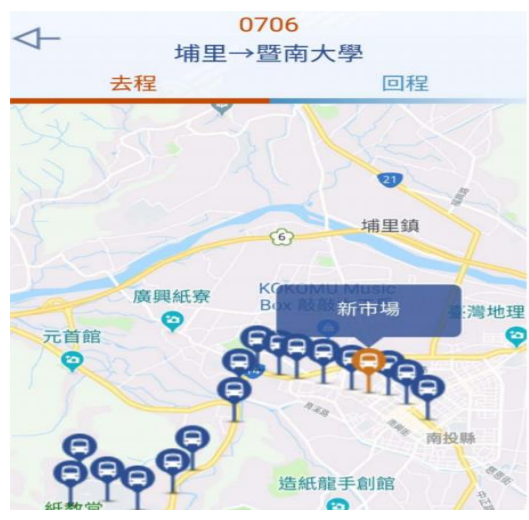
補充: 點選步驟 4 中【站牌地圖】, 即可查詢站牌位置